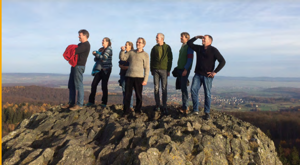
Mitglieder der PomKom auf der Suche nach Fruchtproben – volle Erträge bleiben dieses Jahr aus