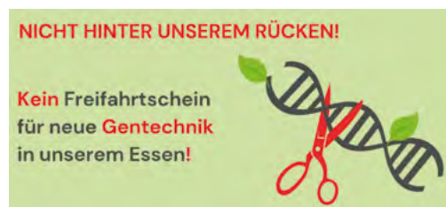
Abb. Bund Ökologische Lebensmittelwirtschaft e.V. (BÖLW)