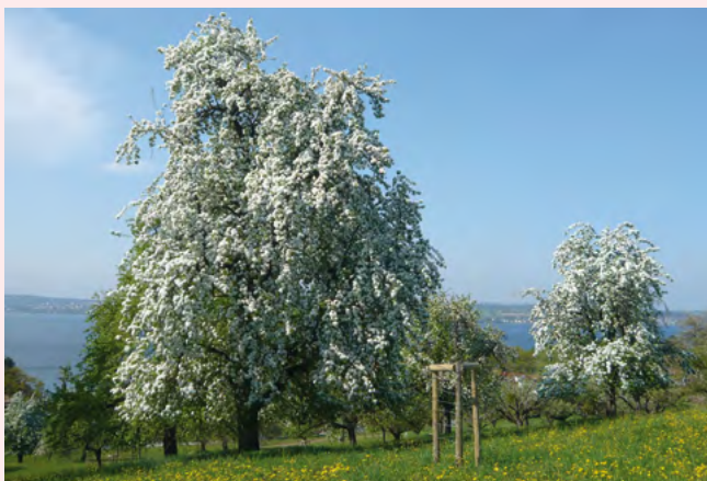
Photo: Splendide floraison d'un Grünmostler au Lac de Constance

La Pomologie traite de la connaissance des variétés fruitières en les identifiant, les décrivant, les conseillant et les préservant.