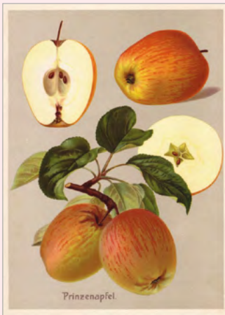
"Prinzen" appel en de "Kirkes" pruim uit "Deutschlands Obstsorten" (1905)