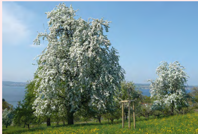
Foto: Bloesempracht van een Grünmöstler (perenras) aan de Bodensee.