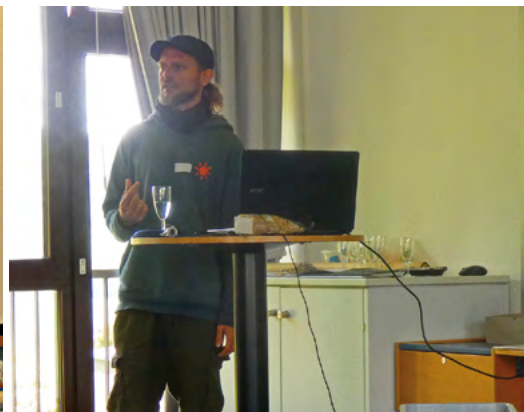
Vielältige Vorträge regten zur Diskussion an.