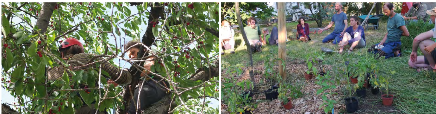
unten: gut besuchtes Sommertreffen der AGO; oben: Suchbild mit Kirschen; rechts: Setzlinge