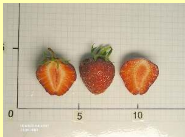
Frühere Weltsorte „Senga Sengana“ aus Deutschland