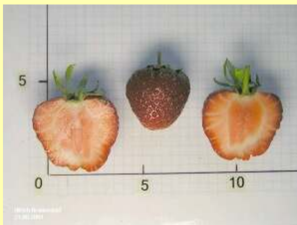
Heutige Weltsorte „Elsanta“ aus den Niederlanden

Insgesamt wurde bei dieser Ausstellung jedoch nur einen Bruchteil der über 1000 heute existierenden Sorten gezeigt. Betrachtete man die Sorten nach ihrer Herkunft und Bedeutung, so waren u.a. die Niederlande mit Weltsorten wie "Elsanta", "Lambada", "Tenira" und "Korona" vertreten, Großbritannien mit "Symphony", "Red Gauntlet" und "Rhapsody", die USA mit "Earlyglow", "Tioga", "Chandler" und "Honeoye", Italien mit "Addie", "Madeleine" und "Marmolada", Frankreich mit "Darflash" und "Mara des Bois", die Schweiz mit "Gerida" und natürlich auch Deutschland mit der unvergessenen, immer noch beliebten "Senga Sengana" sowie den neueren Sorten "Laroma", "Mars" und "Julietta".