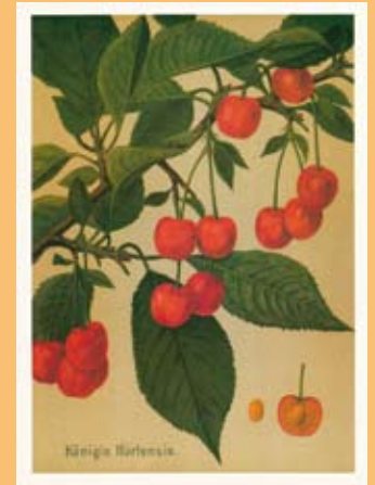
„Muskateller Birne“ und „Königin Hortensia“ aus: „Deutschlands Obstsorten“ (1905)