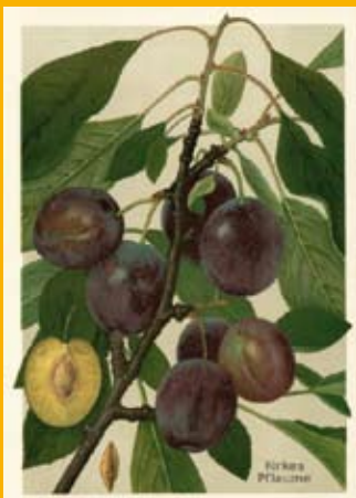
„Prinzenapfel“ und „Kirkes Pflaume“ aus: „Deutschlands Obstsorten“ (1905)