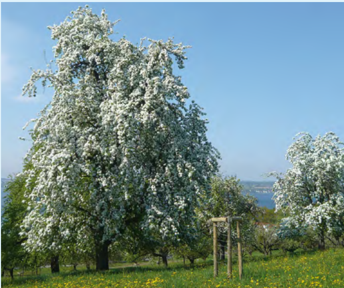
Foto: Blütenpracht eines Grünmöstlerbaumes am Bodensee