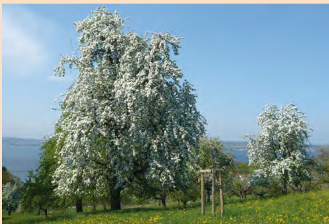
Photo: Splendide floraison d'un Grünmostler au Lac de Constance

La Pomologie traite de la connaissance des variétés fruitières en les identifiant, les décrivant, les conseillant et les préservant.