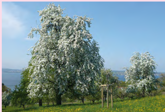
Zdjęcie: Kwitnąca grusza odmiany „Grünmöstler“ nad Jeziorem Bodeńskim