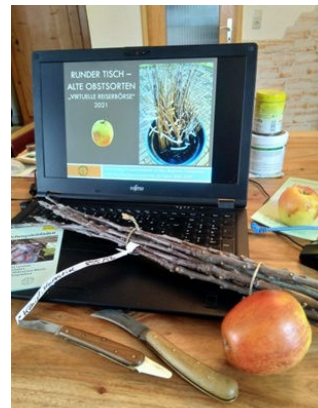
Abb.: virtuelle Reiserbörse 2021