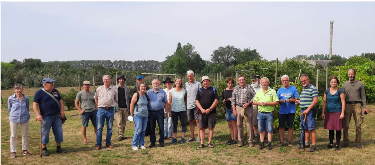
Gruppenbild vom Besuch in Gülzow, trotz der Hitze waren alle bei bester Laune

Die Pomologen-Götter waren uns an diesem Tag gnädig. Es war zwar drückend schwül-heiß und rundherum grummelten Gewitter, wir kamen jedoch trocken über das Versuchsfeld. Nur ein paar Kilometer östlich sofften die Äcker regelrecht ab.